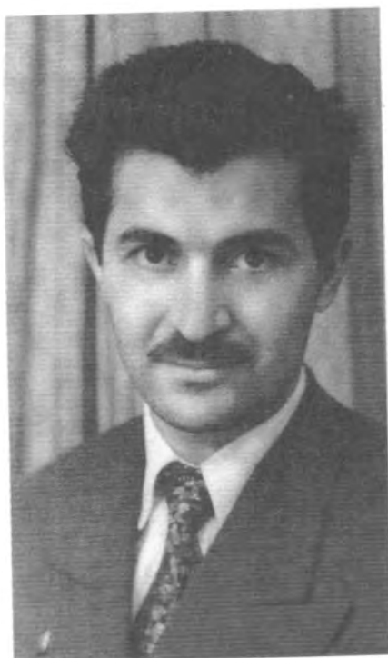
دوای کوتایی زانکو